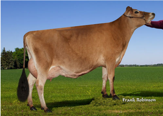
VIERRA MIA GRANDDAM