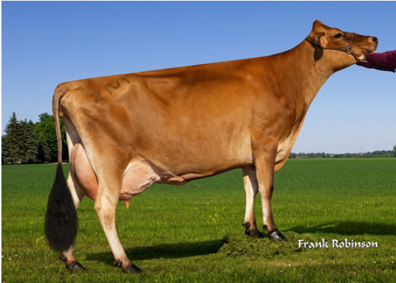
CAL-MART VICEROY MACY 266 THIRD DAM